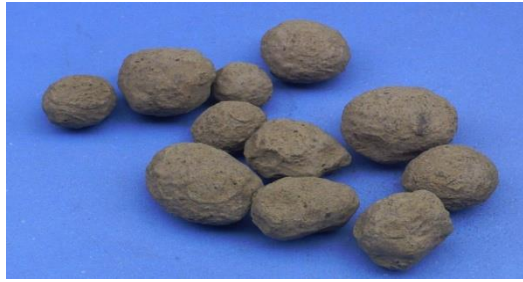
Gambar 2. Agregat Buatan dengan Perbandingan Berat Campuran 3 Bottom Ash dan 1 Fly Ash .