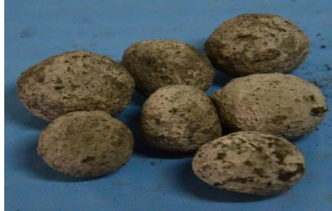
Gambar 1. Agregat Buatan.

Agregat kasar yang digunakan pada langkah kedua yaitu pembuatan beton, adalah agregat buatan berbahan bottom ash dan fly ash . Sebelum digunakan terlebih dahulu dilakukan pengujian karakteristik terhadap agregat buatan antara lain, berat jenis, water content , dan kuat tekan (dibentuk kubus ukuran 5 cm x 5 cm x 5 cm). Visualisasi agregat buatan dapat dilihat pada Gambar 1.