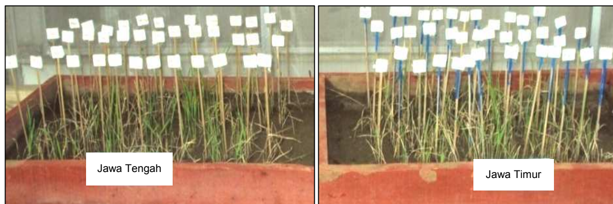
Gambar 1. Penampilan gejala kerusakan varietas uji pada bak penapisan setelah diinfestasi dengan nimfa instar 2 dan 3 WBC populasi Klaten (kiri) dan populasi Banyuwangi (kanan).

Respons ketahanan sebagian besar tanaman F 2 lebih condong ke arah sangat tahan dan tahan (skor kerusakan 0 dan 1) dan sisanya menyebar hampir merata pada skor kerusakan 3–9. Sebaran jumlah tanaman seperti ini mengindikasikan bahwa ketahanan dikendalikan oleh gen tunggal mayor. Pengelom-