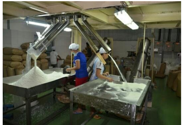
Gambar 9. Meja Picker (Processing)

Gambar 6. Menunjukkan bahwa dibagian Washing fungsinya adalah pencucian daging kelapa dengan air .