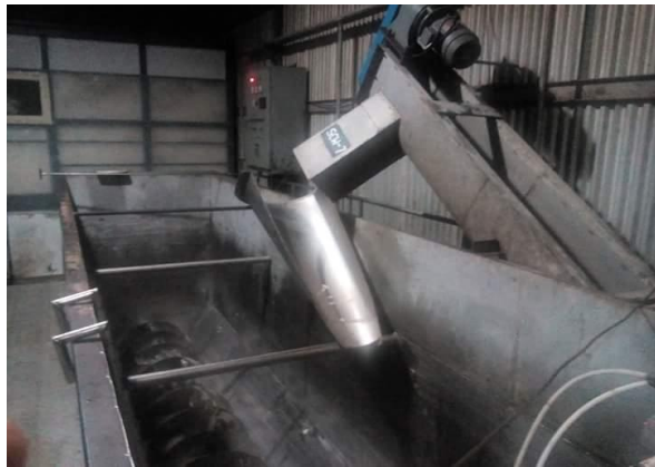
Gambar 6. Washing (Processing)

Gambar 6. Menunjukkan bahwa dibagian Washing fungsinya adalah pencucian daging kelapa dengan air .