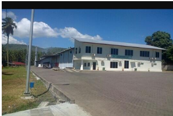
Gambar 1. Kawasan Industri

Industri PT. Global Coconut mulai berdiri pada tahun 2012 dan perusahaan mulai beroperasi pada tahun 2013. Industri PT. Global Coconut yang terletak di Desa Radey memiliki luas lahan lokasi industri sebesar 2,5 hektar dan 1,1 hektar perumahan industri jadi total 3,6 ha.