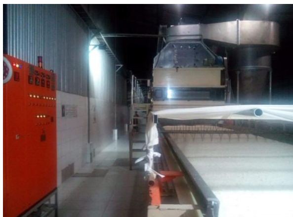
Gambar 8. Driyer (Processing)

Gambar 7. Menunjukkan bahwa dibagian Grinnder fungsinya adalah penggilingan daging kelapa.