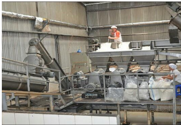
Gambar 7. Grinnder (Processing)

Gambar 9. Menunjukkan bahwa dibagian meja picker fungsinya adalah mengangkat kotoran hitam.