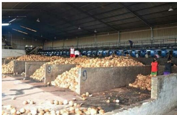
Gambar 2. Bodega ( Opening )

Gambar 2. Adalah gambar dari area bodega. Bodega adalah tempat penampung kelapa setelah dimasuk dari para pemasok, lalu disortir atau memilih kelapa yang bagus atau kelapa yang tidak terbelah.