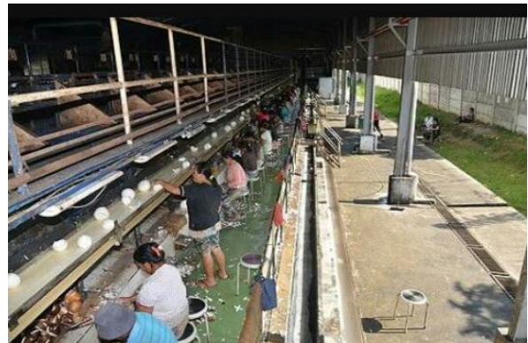
Gambar 4. Perer ( Opening )

Gambar 3. Menunjukan bahwa dibagian seler adalah tahap dimana alat ini berfungsi untuk memisahkan daging kelapa dari tempurung.