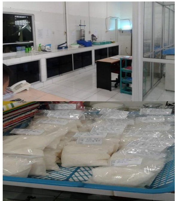
Gambar 10. Laboratorium (Processing)

Gambar 8. Menunjukkan bahwa dibagian Dryer fungsinya adalah pengeringan.