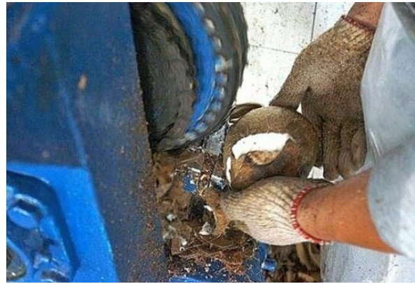
Gambar 3. Seler ( Opening )

Gambar 2. Adalah gambar dari area bodega. Bodega adalah tempat penampung kelapa setelah dimasuk dari para pemasok, lalu disortir atau memilih kelapa yang bagus atau kelapa yang tidak terbelah.