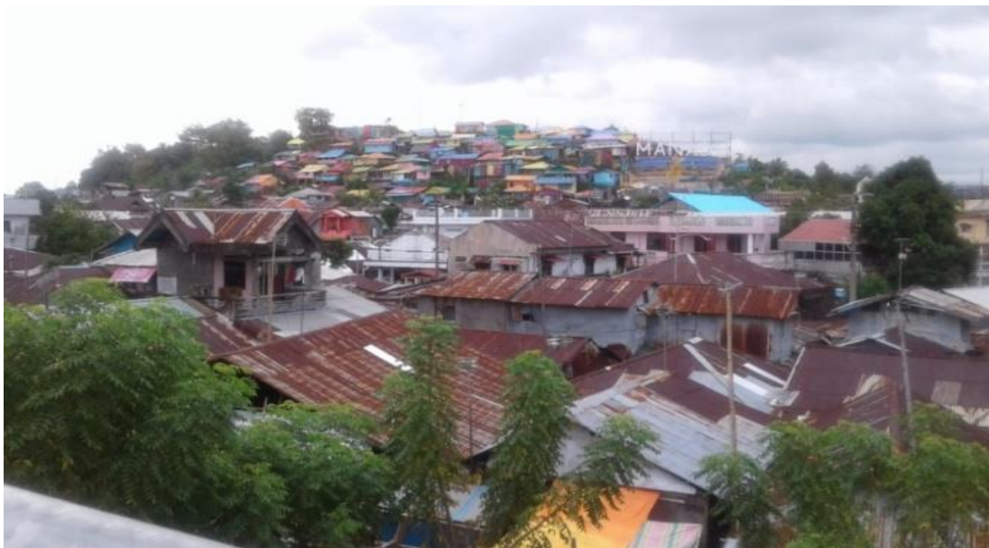
Gambar 2. Kawasan Permukiman Kumuh Sindulang Satu