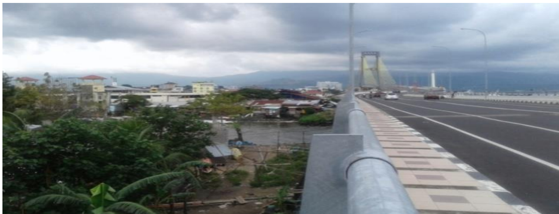
Gambar 5. Nilai Strategis Kawasan Sindulang Satu