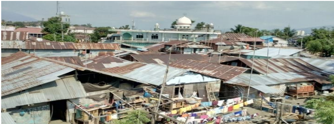
Gambar 3. Kondisi Fisik Bangunan