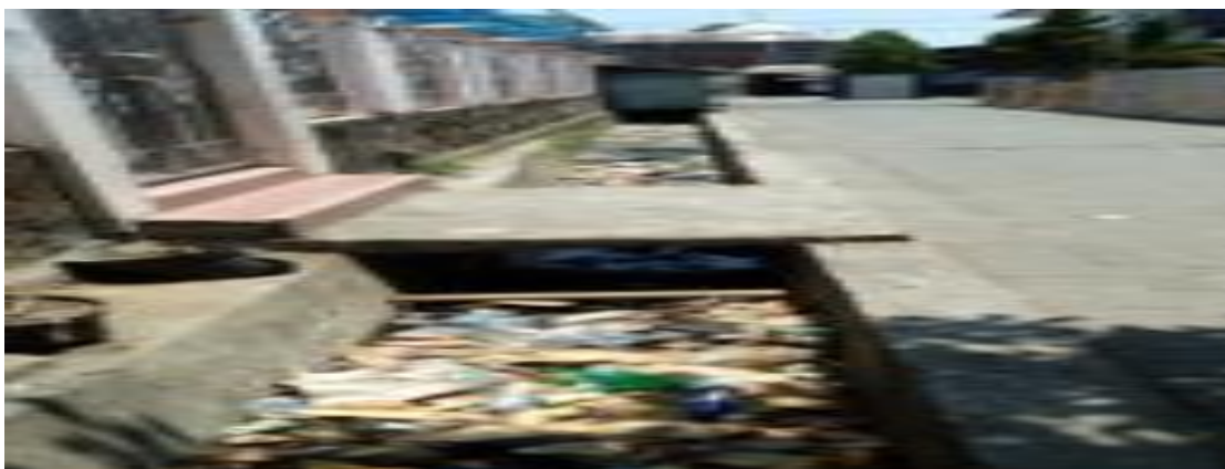
Gambar 4. Kondisi Saluran Drainase