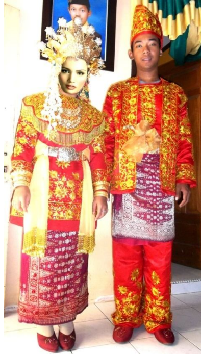
Gambar : Busana Pengantin Melayu Jambi