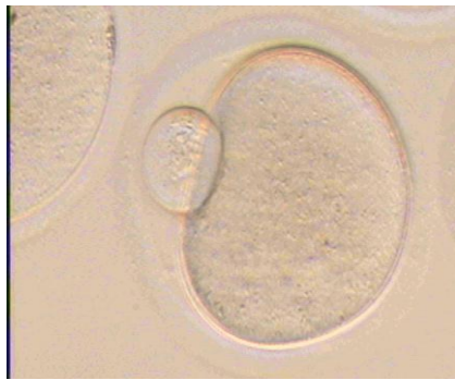
Gambar 1. Oosit Mencit yang Telah Mature Ditandai dengan Polar Body (PB). Bar : 50µm.

Oosit hasil superovulasi didapatkan sebagian besar dalam tahap metafase II (Gambar 1). Pada tahap ini oosit telah matang dan siap mengalami pematangan. Maturasi (tingkat kematangan) oosit meliputi maturasi inti dan sitoplasma. Proses perkembangan oosit berikutnya terjadi oleh penetrasi spermatozoa. Penetrasi spermatozoa akan merangsang sel telur untuk menyelesaikan proses meiosis II yang menghasilkan 3 badan polar dan satu pronukleus betina. Masuknya spermatozoa dalam ooplasma menyebabkan reorganisasi penyebaran protein di dalam ooplasma. 8