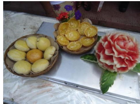
Gambar 3. Jenis produk jajan produksi kelompok wanita binaan IbW

keluarga dengan membuat produk yang bernilai ekonomis. Di samping itu dengan adanya Bumdes maka semua produk yang dihasilkan oleh kelompok wanita akan pasti terjual melalui Bumdes. Bumdes selanjutnya akan menjual produk tersebut ke Bumda (badan Usaha Milik Pemda). Bumda merupakan lembaga yang memiliki otoritas dalam pengepakan dan melakukan quality control terhadap produk-produk kelompok.