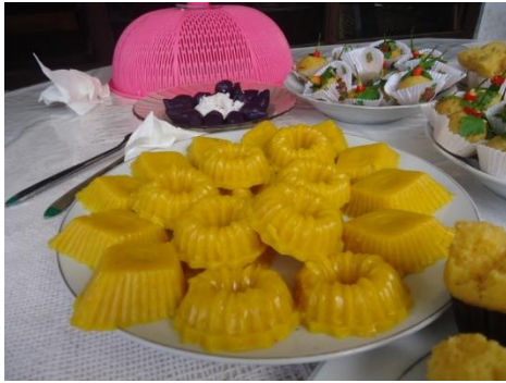
Gambar 2. Salah satu spesifikasi produk Bumdes di desa Tiyang Gading

Program yang menjadi prioritas pada pemberdayaan kelompok wanita di sasaran program IbW adalah peningkatan pendapatan melalui perluasan jaringan pemasaran (kepastian pasar dan harga). Sudah menjadi pandangan umum bahwa wanita merupakan bagian dari keluarga yang memiliki peran domestik yaitu mengurus rumah tangga, anak-anak dan kebutuhan keluarga lainnya. Dari pandangan ini seolah wanita tidak memiliki kesempatan untuk berkiprah pada ranah publik, terutama pada ranah yang mampu menghasilkan pendapatan tambahan bagi keluarga. Untuk mematahkan stereotip ini maka pemberdayaan terhadap kelompok wanita di Subak Anyar dan desa Tiyang Gading telah dilakukan dalam bidang ketrampilan pengolahan jajan kering dan jajan berbahan baku non beras. Pemberdayaan ini mempunyai luaran agar hasil bumi yang ada di sekitar kelompok wanita di daerah sasaran termanfaatkan dan peningkatan lifeskill akan mampu menambah pendapatan