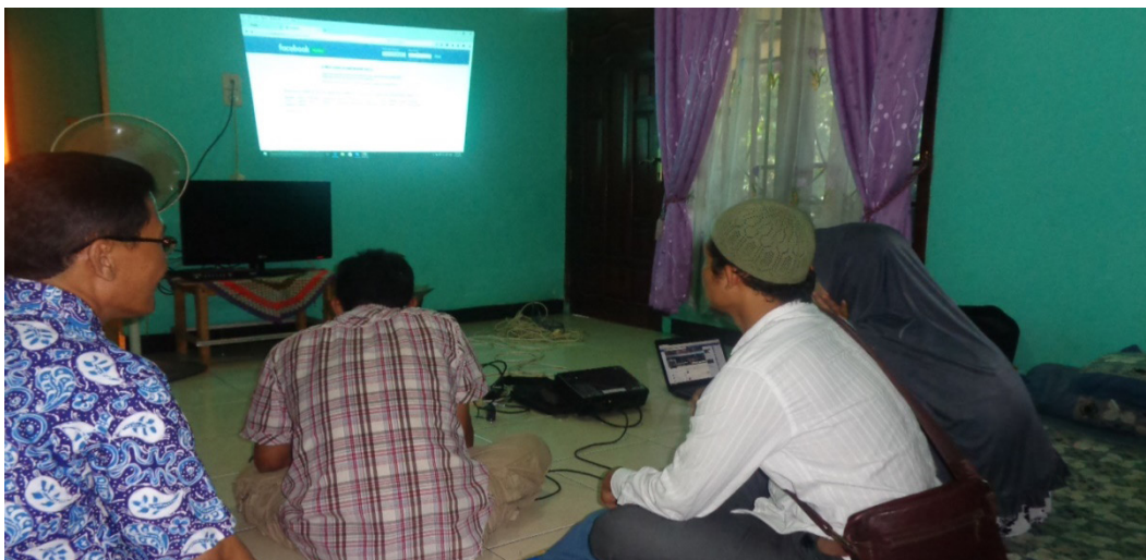
Gambar 4. Pelatihan Pemasaran Berbasis Internet Adapun hasil wordpress kelompok mekar jati sebagai berikut

dan memasarkan aneka jenis keripik olahan. Untuk mewujudkan program tersebut tim I&M melakukan pelatihan pemasaran produk dengan membuat wordpress untuk kelompok Mekar Jati dan diikuti oleh beberapa pengrajin. Pelatihan dilakukan pada tanggal 13 Mei 2016