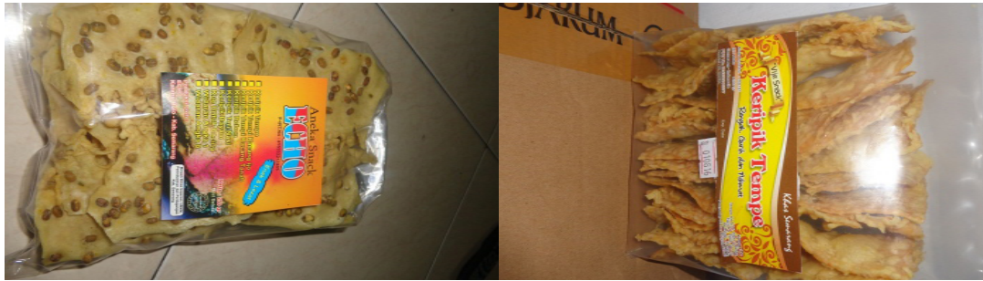
Gambar 3. Produk Unggulan Yang Dihasilkan

Sedangkan solusi pengembangan pemasaran produk terkait dengan mengenalkan konsumen tentang varian yang dihasilkan adalah jenis hasil olahan industri aneka keripik olahan maka perlu informasi yang lebih detail sebagai upaya ekstra untuk memperkenalkan