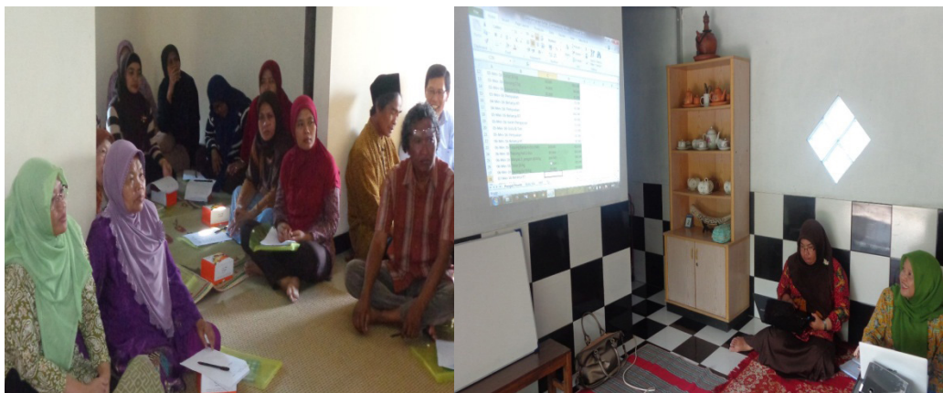
Gambar 5. Pelatihan Pencatatan Keuangan

Pertanggungjawaban ini sangat penting dalam rangka upaya mengembangkan usaha yang telah dan akan dilakukan serta untuk mengetahui omset yang diperoleh. Untuk mewujudkan tujuan tersebut tim I&M melakukan pelatihan pencatatan keuangan sederhana.