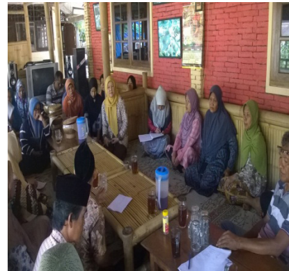
Gambar 2. Forum Group Discusstion (FGD)

Selanjutnya rencana tindak terkait dengan label kemasan bahwa sebagian besar pengrajin dalam melakukan kemasan produk keripik olahan masih sangat sederhana yaitu banyak yang menggunakan kemasan polos (non label). Sehingga penjualan hanya terbatas pada pasar tertentu saja. Pengrajin belum punya suatu pengetahuan/wawasan tentang pentingnya sebuah brand name kemasan produk, yang merupakan identitas produk sehingga konsumen bisa lebih mengenal dan minat untuk beli dan bisa bersaing dengan produk sejenis di pasaran. Salah satu upaya untuk memperluas pangsa pasar pengrajin perlu melakukan design ulang atas kemasan agar lebih menarik sehingga dapat meningkatkan nilai jual. Dengan menggunakan brand name kemasan produk menjadikan kemasan lebih menarik yang merupakan identitas makanan khas daerah Karangbolo Ungaran Barat. Dengan menggunakan brand name label kemasan produk harga bisa terangkat dan bisa bersaing dengan pengrajin lain. Sehingga omzet produksi pun juga akan meningkat.