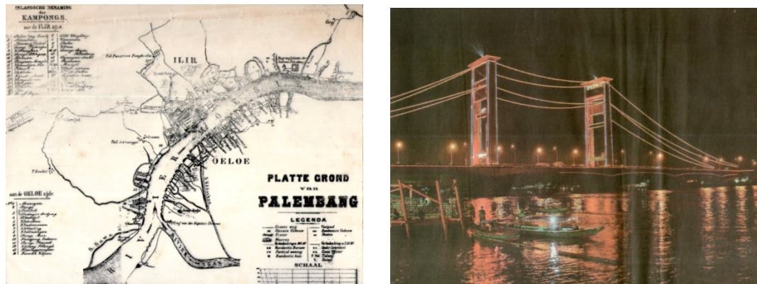
Gambar 2. Peta Kota Palembang Tempo Dulu dan keberadaan Jembatan Ampera yang menjadi penyatu kawasan Seberang Ilir dan Seberang Ulu

Satu-satunya kota di luar Jawa saat itu yang mempunyai stadplan adalah kota Palembang. Implementasi dari stadplan Palembang adalah dibangunnya industrial estate di daerah Sungai Gerong dan Plaju dan real estate di Talang Semut. Demikian juga dengan keberadaan Jalan Liingkar II :Jalan Kapten Rivai dan Jalan Veteran merupakan infrastruktur jalan berbentuk ring road dan radian yang mencapai Talang Gerunik.