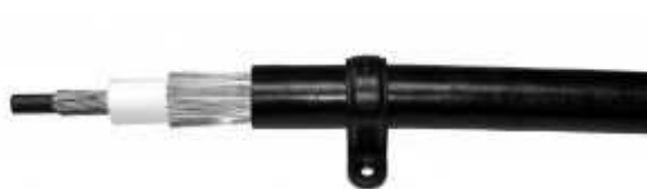
Gambar 2. E.F Carrier

Penelitian ini menggunakan E.F Lightning Protection System yang bersifat seperti penangkal petir elektrostatik dimana terdapat penambahan elektron yang diinduksi dari permukaan bumi sehingga muatan-muatan yang terkumpul pada bagian penangkal petir itu menarik muatan-muatan pada awan. Sistem ini memiliki 2 bagian yaitu E.F Carrier dan E.F Terminal .