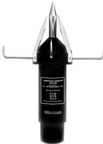
Gambar 3. E.F Terminal