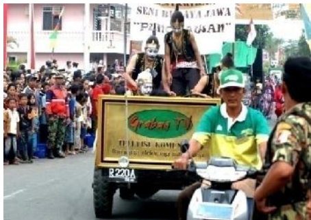
Gambar.1 Grabag TV berpartisipasi dalam Karnaval menyambut Peringatan HUT RI ke 62

Semua contoh kegiatan seni dan budaya yang dijelaskan di atas merupakan materi dalam program informasi seputar kesenian dan budaya bagi stasiun Grabag TV. Sehingga dengan adanya dokumentasi kegiatan tersebut yang dikemas kedalam bentuk program acara televisi di Grabag TV, dapat memberikan hiburan bagi masyarakat komunitasnya pada malam hari. Dimana pada saat acara berlangsung mereka tidak dapat menyaksikan secara langsung karena kesibukan mereka disaat itu. Dengan adanya program ini di Grabag TV maka mereka dapat menyaksikannya. Berikut ini adalah salah satu foto kegiatan kesenian yang diliput oleh Grabag TV.