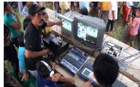
Gambar 5. Salah satu Pengarah Acara Grabag TV sewaktu produksi program pagelaran seni tradisi Soreng (Foto: Najmi, April, 2012)