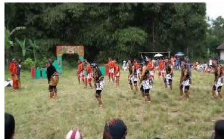
Gambar 6. Pagelaran seni tradisi Soreng, salah satu program Grabag TV