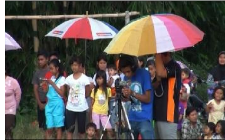
Gambar 4. Salah satu kameraman Grabag TV dalam produksi program pagelaran seni tradisi Soreng (Foto: Najmi, April, 2012)