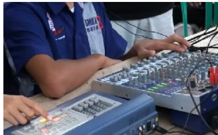
Gambar 8. Peralatan switcber dan audio mixer yang digunakan Grabag TV

Pelaksanaan produksi yang dilakukan oleh Grabag TV pada program pagelaran seni tradisi Soreng ini adalah dengan rekaman secara live on tape yaitu produksi dilaksanakan dengan multi kamera dengan dikendalikan dari sub control dan hasilnya direkam terlebih dahulu.