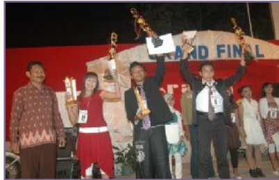
Gambar 2. Para pemenang Golav (Grabag Olah Vokal), atau sering disebut Grabag Idol, bersama Camat Grabag. Disiarkan langsung oleh Grabag TV pada tahun 2007.

Berikut ini adalah foto kegiatan di bidang seni pertunjukan musik yang dilakukan Grabag TV: