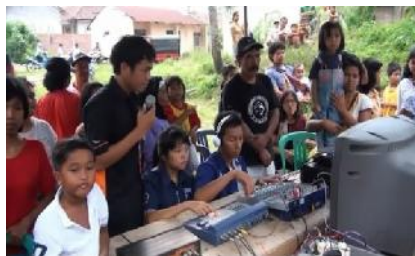
Gambar 3. Proses produksi pagelaran seni tradisi Soreng yang dilakukan kru Grabag TV dengan menggunakan multi kamera dan switcher. (Foto: Najmi, April 2012)

Dalam pembentukan kru pada sebuah produksi di Grabag TV sifatnya sukarela, tidak ada suatu keharusan atau keterpaksaan untuk terlibat dalam produksi program apapun bentuknya. Tidak hanya kru saja, dalam masalah persiapan peralatan, transportasi dan akomodasi yang lain pun dibantu oleh masyarakat komunitas tanpa dipungut biaya, dalam artian bersifat gotong royong. Produksi program seni dan budaya misalnya, komunitas Grabag melakukan produksi program ini dengan sukarela. Siapa yang memiliki waktu pada saat acara di produksi maka akan membantu jalannya produksi acara. Hal ini dapat dilihat pada dokumentasi kegiatan berikut.