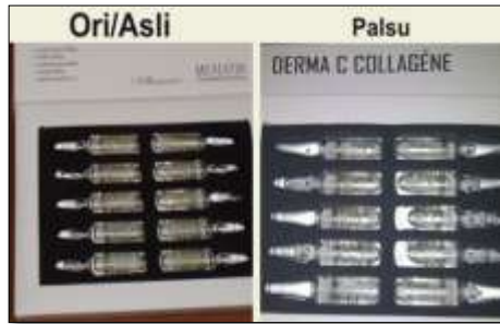
Gambar 1. Perbandingan Vaksin Palsu dan Asli

Persamaan pada label, baik itu warna, tulisan huruf maupun angka memang tidak dapat dibedakan secara kasat mata. Hal tersebut menimbulkan kekeliruan di masyarakat. Sebenarnya penyebaran vaksin palsu sudah menyebar sejak tahun 2003 namun memang baru marak dibahas sejak Juni 2016. Hal ini menjadi diketahui oleh masyarakat luas karena didorong oleh kondisi ketersediaan vaksin yang memang mulai langka pada Bulan Juni 2016 tersebut, khususnya untuk vaksin import .