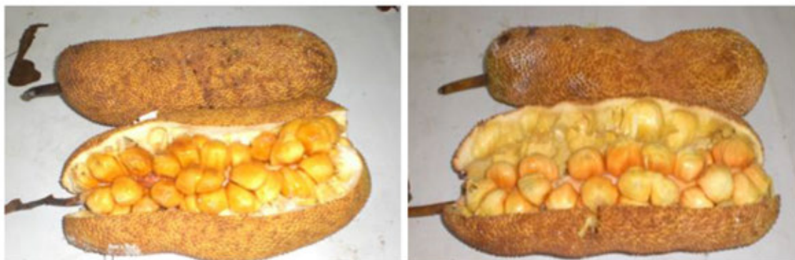
Gambar 1. Warna Kulit dan Daging Buah Cempedak Lokal di Bogor

Karakteristik buah cempedak lokal di Bogor disajikan pada Tabel 1. Berat biji cempedak dapat mencapai sekitar 25% dari total berat buahnya, hal ini terlihat dari Tabel 1 yang menunjukkan berat biji 342,40 g dengan berat buah