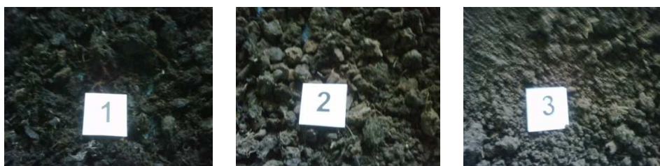
Gambar 1. Kenampakan fisik tanah gambut dari Rawa Pening, Jawa Tengah (1) Gambut dari lahan yang masih dipenuhi tumbuhan enceng gondok, (2) Gambut dari lahan yang enceng gondoknya telah dipanen (<24 jam) dan (3) Gambut yang sudah ditiriskan di pinggir rawa

Secara fisik kenampakan tanah gambut Rawa Pening yang berasal dari 3 (tiga) lokasi pengambilan sampel berbeda. Gambar 1. menunjukkan fisik tanah gambut Rawapening yang diambil dari 3 (tiga) lokasi yang berbeda, di mana pada lokasi 1 masih pada kondisi alami dengan pertumbuhan enceng gondok di atasnya, lokasi 2 pada kondisi setelah tanaman enceng gondok dipanen, sedangkan lokasi 3 pada tanah gambut yang sudah ditiriskan. Perbedaan dalam kenampakan fisik tanah gambut Rawa pening disebabkan oleh adanya perbedaan nilai pH dan kadar air bahan, oleh adanya proses yang berlangsung pada masing-masing lokasi (Tabel 2.).