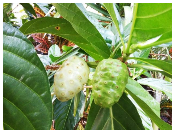
Gambar 1. Buah Mengkudu

Alat yang digunakan dalam penelitian ini adalah wadah plastik, batang pengaduk, gelas ukur, sonde lambung tikus, dan Multi Monitoring System Autocheck . Bahan yang digunakan dalam penelitian ini adalah buah mengkudu ( Morinda citrifolia L.) (Gambar 1), etanol 96 %, aloksan, Insulin Novomix, aquades, air minum, dan pakan AD2.