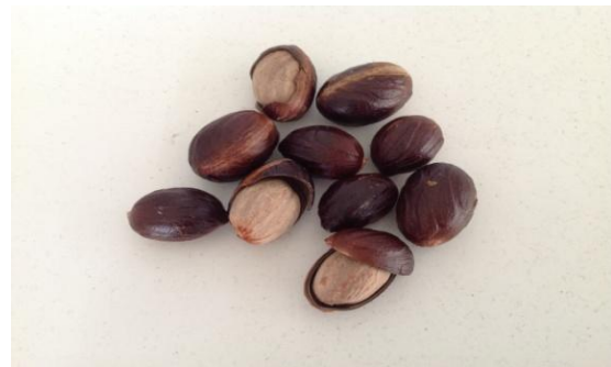
Gambar 1. Biji Pala ( Myristica fragrans Houtt.)