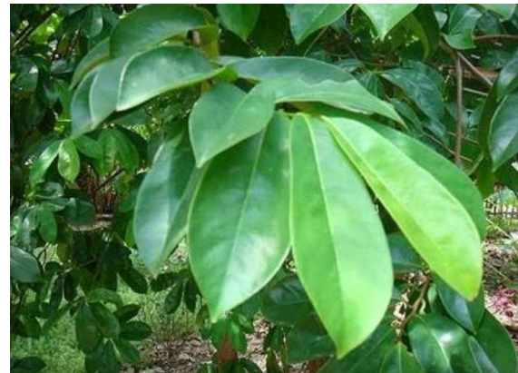
Gambar 1. Daun srikaya yang digunakan dalam penelitian