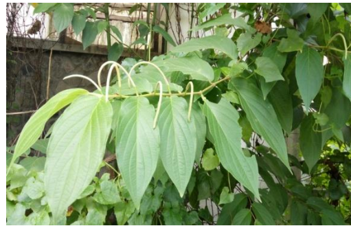
Gambar 1. Daun Piper aduncum L.

Alat yang digunakan dalam penelitian ini terdiri dari wadah makanan, botol minuman, wadah plastik, kawat kasa, blender, oven, toples, corong, batang pengaduk, vacuum rotary evaporator , timbangan analitik, gelas ukur, cawan petri, kertas saring dr. Watts no. 1, Multi Monitoring System Autocheck , gunting minor set, sonde lambung, disposable syringe 1 cc. Bahan yang digunakan dalam penelitian ini adalah daun sirih hutan ( Piper aduncum L.) (Gambar 1), aquades, NaCl 0,9%, CMC 1%, aloksan, novomix, pakan AD2, etanol 96%, alkohol 70%.