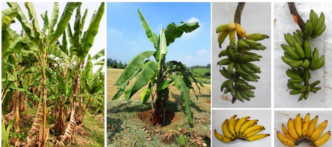
Gambar 3. Penampilan Pisang Rejang diploid (AA) dan Pisang Rejang tetraploid (AAAA) ( Performance of diploid Pisang Rejang (AA) and tetraploid Pisang Rejang (AAAA) )

Keterangan ( Notes ): Kolom 1= Marker (100 bp plus DNA ladder (Fermentas) 2-4 = Rejang 2x, 5-11 = Rejang 4x, 12-18 = Rejang mixoploid Ukuran Marker (mulai dari yang terbawah hingga teratas) (bp): 100, 200, 300, 400, 500, 600, 700, 800, 900, 1000, 1200, 1500, 2000, dan 3000 Column 1= Marker (100 bp plus DNA ladder (Fermentas) 2-4 = Rejang 2x, 5-11 = Rejang 4x, 12-18 = Rejang mixoploid. Marker size (lowest to highest) (bp): 100, 200, 300, 400, 500, 600, 700, 800, 900, 1000, 1200, 1500, 2000, dan 3000