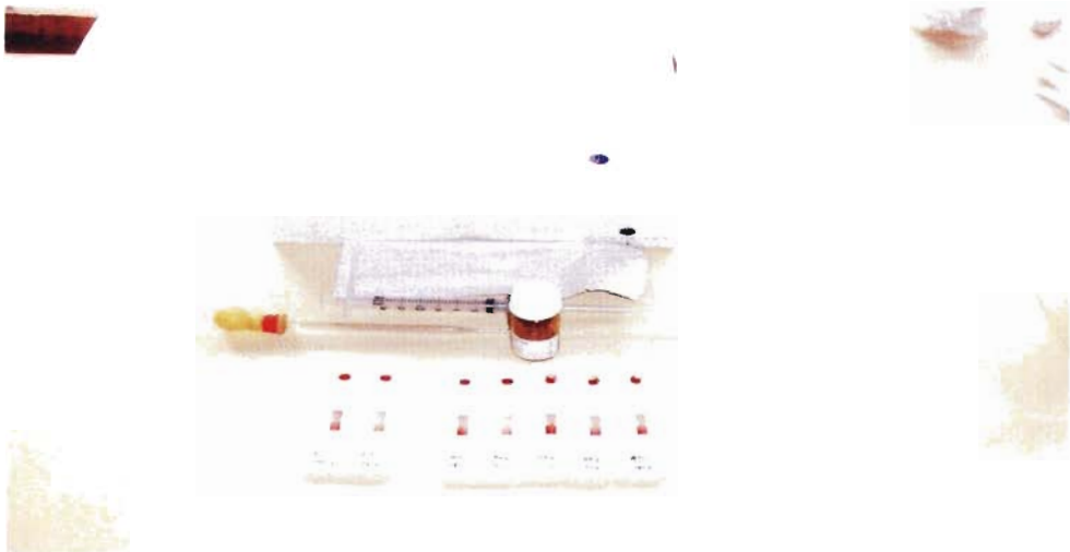
Gambar 2. Peralatan diagnosis cepat Leptotek, jenis Lateral Flow .

Persentase keberhasilan penangkapan atau trap success dihitung berdasarkan jumlah tikus tertangkap dibagi dengan jumlah hari penangkapan dikalikan jumlah perangkap dipasang. Trap success ini di-