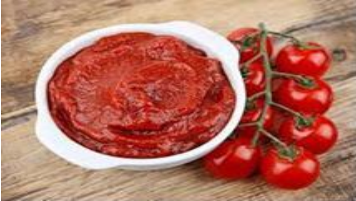
Gambar 5 Tomato paste