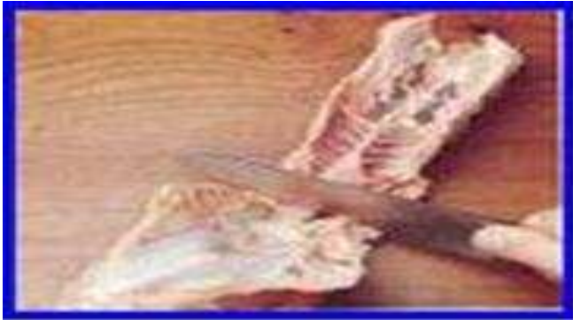
Gambar 2. Tulang ayam