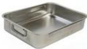
Gambar 8 Roasting pan