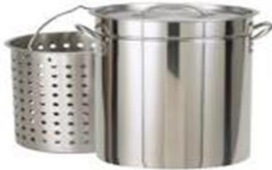
Gambar 7 Stock pot