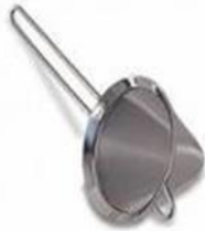
Gambar 12 Conical strainer