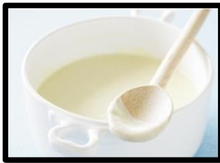
Gambar 17 Bechamel Sauce

Sauce bechamel merupakan sauce yang terbuat dari white roux yang ditambah dengan susu. Saus bechamel cocok dihidangkan dengan pasta (lagsana, canelonne, caserol), ikan dan sefood.