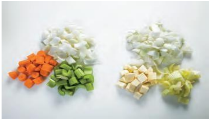
Gambar 4 Mirepoix (kiri) dan white mirepoix (kanan)

Aromatic Vegetable merupakan bahan yang memberikan aroma dalam pembuatan stock. Mire poix (meer pwah) perpaduan sayuran antara bawang Bombay (onion), wortel (carrot), seledri (celery) dengan singkatan dalam dapur continental OCC. Porsi dalam penggunaan mirepoix yang tepat adalah untuk mendapat 400 gr mirepoix terdiri dari onion 200 gram (50%), carrot 100 gram (25%) dan celery 100 gram (25%). Ada mirepoix putih yang terdiri dari parsnip, celery, onion kadang ditambahkan potongan mushroom.