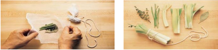
Gambar 6 satchet (kiri) dan bouqute arni (kanan)