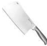
Gambar 10 Bone knife