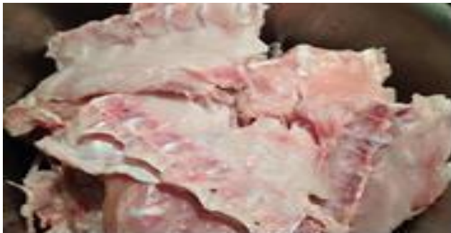
Gambar 3 Tulang Tulang ikan