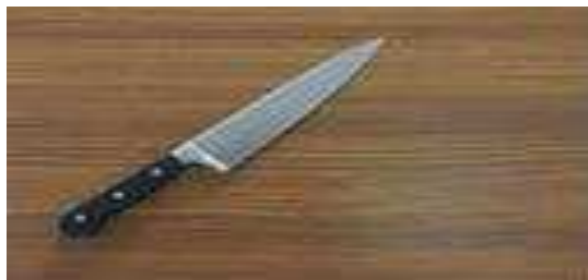
Gambar 11 Vegetable knife