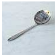
Gambar 14 Perforated spoon