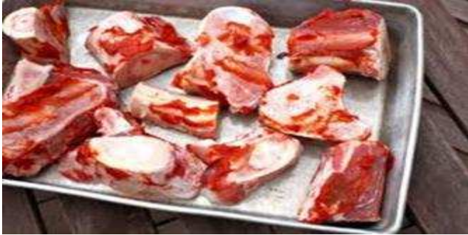
Gambar 1. Tulang sapi