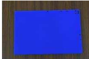
Gambar 9 Chopping board