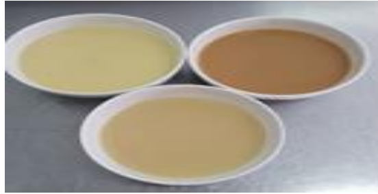
Gambar 16 White,blond,brown roux