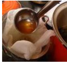
Gambar 13 Tammy cloth