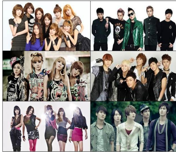
Gambar 1. Korean Girl Band dan Korean Boy Band