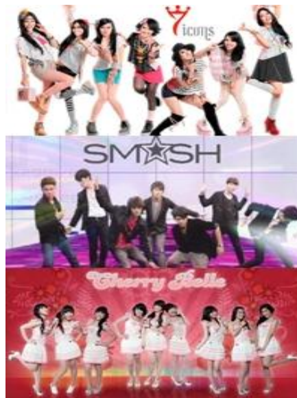
Gambar 2. Sejumlah boy band dan girl band Indonesia yang secara visual meniru tampilan boy band dan girl band Korea