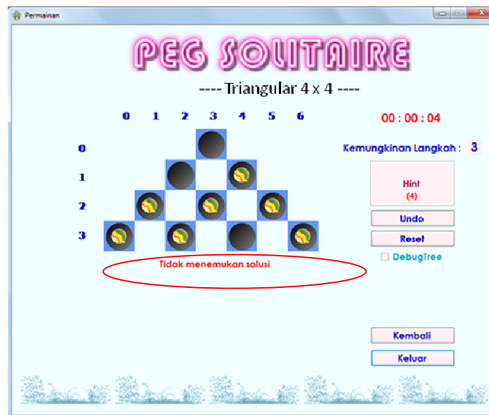
Gambar 5. Soal yang tidak menemukan solusi

berjauhan satu sama lain, maka akan semakin sulit dalam melakukan penelusuran. Posisi kelereng yang tersebar berjauhan di papan berukuran besar pun semakin mempersulit penelusuran. Berdasarkan hasil pengujian di atas, juga ditemukan salah satu soal yaitu soal dengan ID 7 yang tidak menemukan goal berupa sisa 1 kelereng. Hal ini disebabkan karena saat dilakukan penelusuran terhadap kondisi tersebut, tidak ada kemungkinan perpindahan kelereng yang menghasilkan jalur solusi menuju sisa 1 kelereng. Terakhir, berdasarkan pengujian keseluruhan, ada dua kemungkinan suatu kondisi tidak berhasil menemukan solusi. Kemungkinan pertama disebabkan oleh penelusuran terhadap kondisi tersebut yaitu tidak ada kemungkinan perpindahan kelereng yang menghasilkan jalur solusi menuju sisa 1 kelereng. Hal ini dapat dilihat pada bagian contoh soal yang tidak menemukan solusi pada gambar berikut.