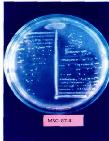
Foto 1. Hasil isolasi dan pemurnian membentuk satu koloni bakteri endofitik yang sudah murni