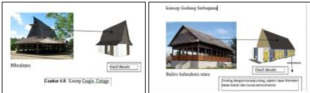
Gambar 1.4 Konsep Cottage (kiri), konsep aula serbaguna(kanan)