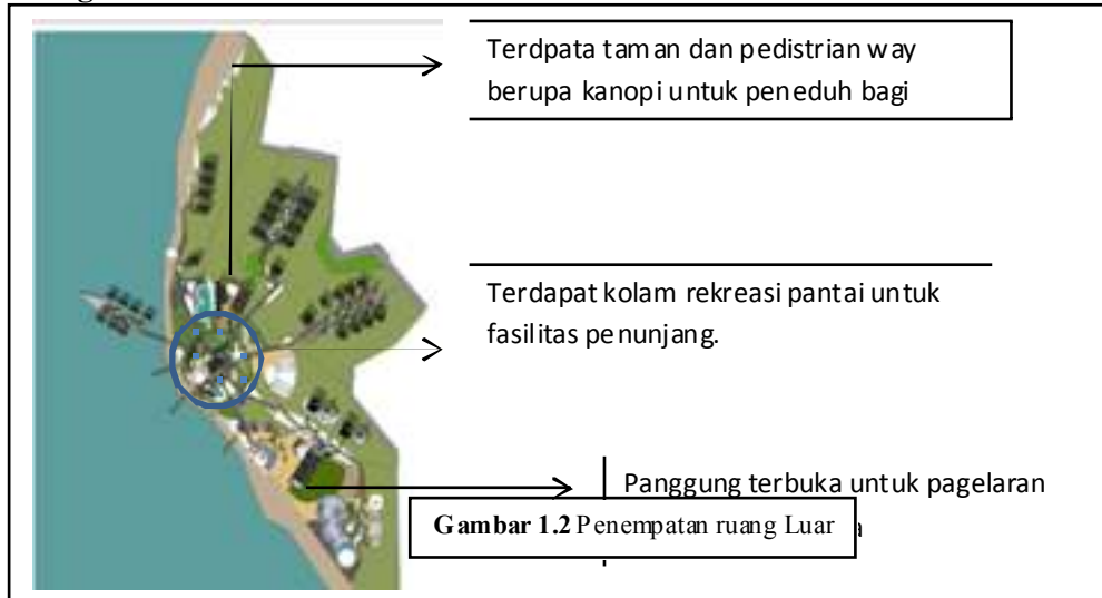
Gambar 1.2 :penempatan Ruang Luar