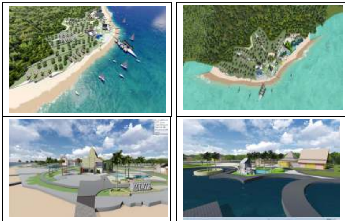
Gambar 1.6 : perspektif mata burung (atas), perspektif mata manusia (bawah)