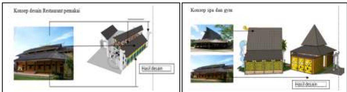
Gambar 1.5 konsep restaurant pemakai (kiri), konsep SPA(kanan) Sumber : hasil rancangan