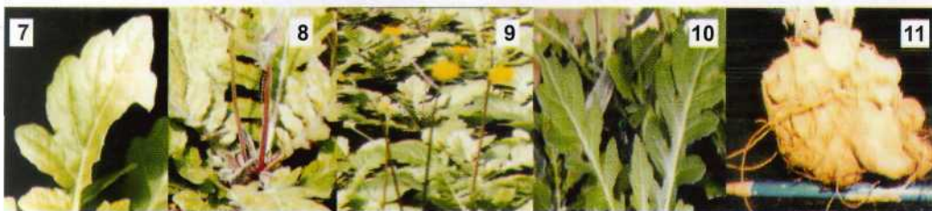
Foto 7 dan 8. Serangan hama ulat. Foto 9,10, dan 11. Pertumbuhan tanaman dan umbi di lapangan.