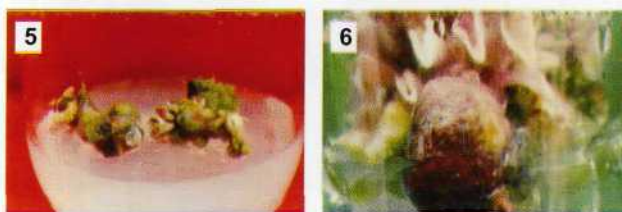
Foto 5 dan 6. Pembentukan umbi mikro.