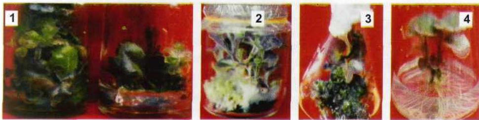
Foto 1, 2 dan 3. Pembentukan tunas pada tahap inisiasi dan perbanyakan dalam media padat dan cair. Foto 4. Planlet (tunas berakar) yang siap dikeluarkan dari botol untuk diaklimatisasikan.