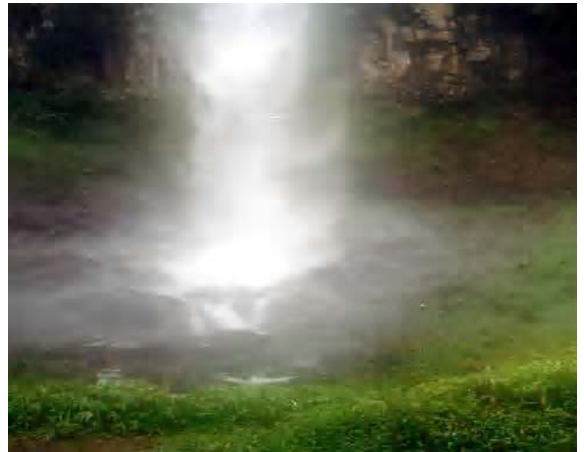
GAMBAR 2. FOTO AIR TERJUN CILEAT DI HULU SUNGAI CIPUNAGARA, PERBATASAN KAWASAN BANDUNG UTARA SUBANG, SEBAGAI SALAH SATU CONTOH SUMBER DAYA AIR YANG DAPAT DIMANFAATKAN UNTUK ENERGI LISTRIK, PARIWISATA, IRIGASI PERTANIAN SERTA PERIKANAN AIR TAWAR.

Pada saat ini, lapangan panas bumi Darajat dikelola oleh PT Amoseas (PT Chevron Texmaco), lapangan panas bumi Kamojang dikelola oleh Pertamina dan PLN, sedangkan lapangan panas bumi Wayang-Windu diakuisi oleh PT Star Energy. Sementara itu lapangan panas bumi Patuha sedang dalam proses pemboran eksplorasi, yang ditangani oleh PT Geodipa Energy.