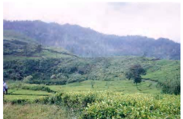
GAMBAR 3. FOTO BENTANG ALAM GUNUNG API PURBA CUPUNAGARA SEBAGAI SUMBER DAYA PANORAMA YANG DAPAT MENAMBAH OBYEK WISATA KEINDAHAN ALAM DI KAWASAN BANDUNG UTARA – SUBANG.

Untuk lebih meningkatkan pemanfaatan sumber daya keindahan alam daerah Bandung, maka potensi geologi lainnya masih banyak yang harus ditangani, sebagai contoh ditemukannya manusia Gua Pawon di daerah Padalarang dan candi terkubur di daerah Rancaekek. Sumber daya geologi yang murni bentukan alam seperti gunung api purba Cupunagara (Gambar 3), Situ Lembang, Sesar Lembang, Air terjun Cileat, Kubah Nagreg, Gunung Malabar dan lain-lain juga masih menunggu untuk dipercantik oleh tangan-tangan terampil sehingga menarik bagi para wisatawan.