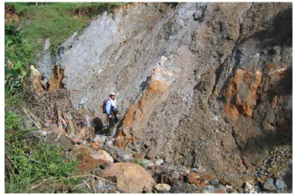
GAMBAR 5. FOTO SINGKAPAN URAT KUARSA SEBAGAI INDIKASI MINERALISASI DI DAERAH CUPUNAGARA, KECAMATAN CISARAK, KABUPATEN SUBANG.

geology ) formasi batuan itu akan berada di kedalaman 200 m ke bawah dari permukaan dataran Bandung (Gambar 6a). Air hujan yang jatuh di daerah Cipaganti ke timur akan mengikuti lapisan batuan itu dan pembukaan lahan di kawasan Cipaganti – Gunung Manglayang (termasuk pemukiman Dago Pakar dan Punclut) tidak menyebabkan kekurangan air di dataran Bandung. Persoalannya, batuan gunung api tidak sepenuhnya mengikuti prinsip stratigrafi kue lapis, tetapi dapat saja per lapisannya saling potong-memotong, sesuai karakter sedimentasinya, apalagi terendapkan di lingkungan darat (Gambar 6b). Dengan demikian pembukaan lahan di kawasan Cipaganti-Gunung Manglayang dapat ikut menjadi penyebab berkurangnya pasokan air di dataran Bandung. Persoalan dasar stratigrafi batuan gunung api ini agar lebih diperhatikan sebelum membuat kebijakan untuk memanfaatkan sumber daya lahan.