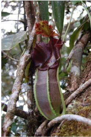
Gambar 2. N. naga