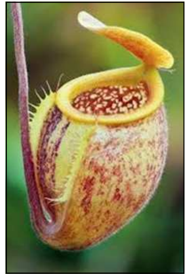
Gambar 7. N. undulatifolia

Sampai dengan tahun 2012, Indonesia telah memiliki 68 jenis Nepenthes (59 jenis di antaranya berstatus endemik) atau 48,9% dari jumlah Nepenthes yang tercatat di dunia (139 jenis). Jumlah tersebut masih dimungkinkan bisa bertambah apabila dilakukan eksplorasi ke berbagai pulau khususnya pulau-pulau kecil, mengingat Indonesia memiliki ribuan pulau kecil yang belum dijajah untuk diteliti. Penelitian Nepenthes di bidang ilmu genetika, fitokimia dan hortikultura belum banyak dilakukan; hal ini