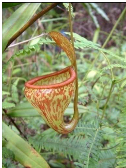
Gambar 5. N. pitopangii