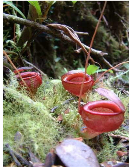
Gambar 4. N. jamban