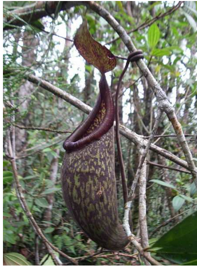
Gambar 3. N. rigidifolia