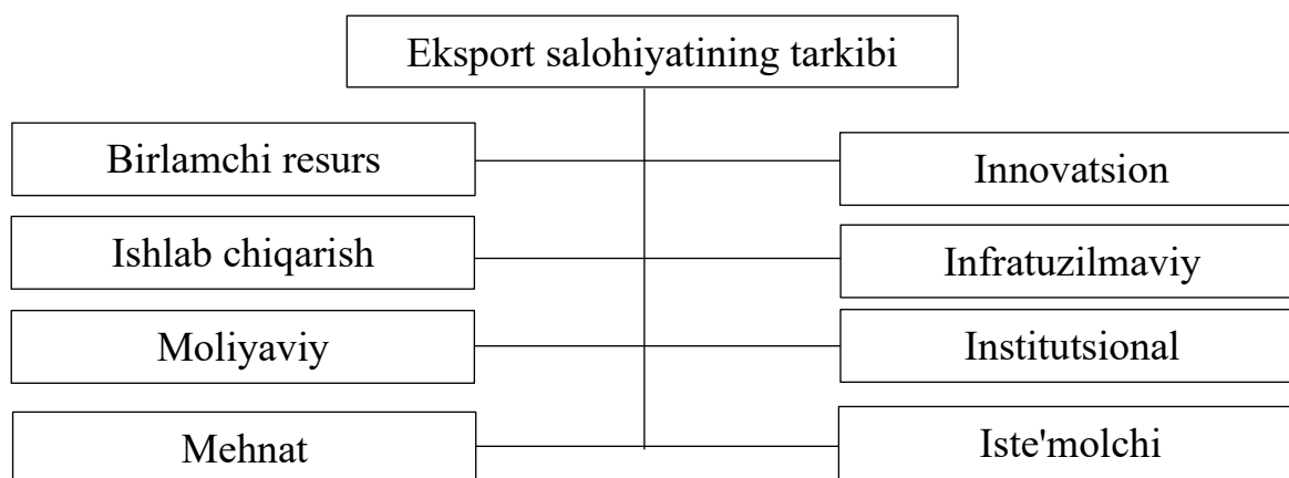
1-rasm. Hudud eksport salohiyatining tarkibiy elementlari