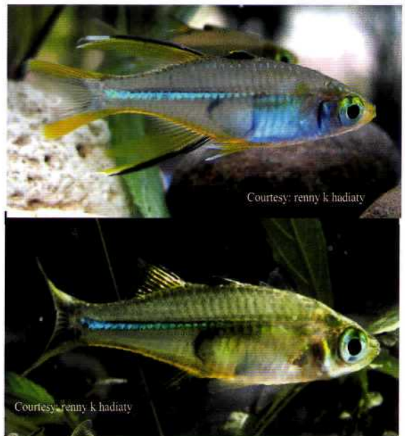
Foto 3. Dimorfisme kelamin pada ikan M. ladigesii , atas: ikan jantan, bawah: betina

Sirip ikan jantan jauh lebih panjang dibanding sirip pada ikan betina, terutama sirip punggung ke dua.