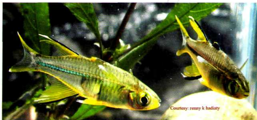
Foto 1. Dua ekor Marosatherina ladigesii jantan dari perairan di Sulawesi Selatan.

Spesimen dari jenis ini juga dijumpai di The Academy of Natural Sciences Philadelphia, Amerika Serikat dengan nomer katalog ANSP 85143 terdiri dari 2 ekor, sedangkan di United States Natural History Museum (USNM) atau lebih dikenal dengan Smithsonian Museum di Washington DC, dijumpai 19 spesimen dengan nomer katalog USNM 340419 (Foto 2). Spesimen dari ANSP dan USNM diamati saat kunjungan ke Philadelphia dan Washington DC pada tahun 2006.