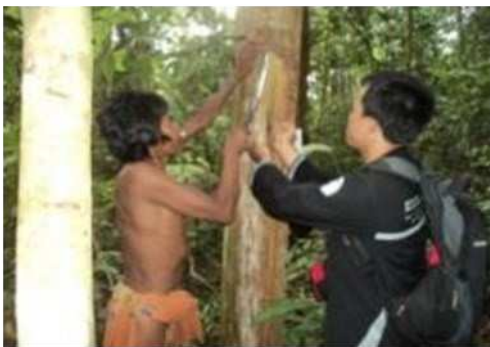
Gambar 1. Pemungutan damar klungkung ( Shorea retinodes ) [Collection of dammar klungkung ( S. retinodes )]

Orang rimba bedemor secara rutin di hutan TNBD menggunakan ambung (keranjang rotan) dan parang. Variasi teknik bedemor berdasarkan fungsi pohon dan letak damar. Pohon penghasil damar dewasa ditandai menghasilkan damar terus menerus tanpa mengenal musim. Tahapan pengolahan dan pemanfaatan damar berdasarkan hak perorangan, tidak diatur hukum adat. Jenis damar yang harus tersedia di sudung (rumah) adalah damar solu, sapot, beyung dan sarong, karena damar tersebut bermanfaat untuk obat luka dan bahan bakar blebayon . Damar yang jarang digunakan adalah damar kedundung dan kawon, karena damar ini keluar dari perlukaan batang akibat penancapan sugu lantak , sehingga damar tersebut diperoleh pada saat selesai panen madu. Ketentuan adat menetapkan pohon sialang tidak boleh dilukai kecuali penancapan sugu lantak . variasi teknik bedemor merupakan wujud