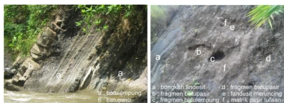
Gambar 1. Kenampakan litologi daerah penelitian.

bedding . Ketebalan batulempung mulai dari sekitar 5 cm hingga 90 cm. Batupasir berwarna abu-abu terang, beberapa karbonatan, berukuran butir pasir sedang-halus, bentuk butir membulat, terpilah baik, kompak, terdapat struktur laminasi paralel, load cast , silang siur dan graded bedding . Ketebalan batupasir mulai dari sekitar 5 cm hingga 60 cm.