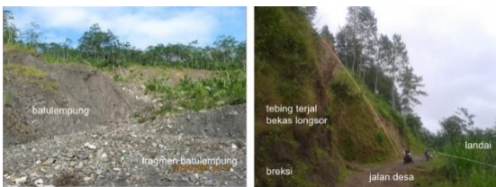
Gambar 4. Pelapukan fisik dan erosi pada batulempung (kiri); Gambaran longsor pada tebing breksi di daerah penelitian (kanan)

Batulempung-batupasir di daerah kajian yang berumur sangat tua yakni Miosen Tengah memiliki riwayat dan rekaman struktur geologi yang kompleks. Pada batuan ini dijumpai lapisan yang hampir tegak dan bahkan telah mengalami pembalikan. Arah jurus dan kemiringan lapisan batuan yang sangat bervariasi menunjukkan adanya perlipatan yang intensif. Intensitas kekar yang tinggi dan sifat batulempung yang mudah mengalami pengembangan maupun pengkerutan telah mempercepat proses pelapukan dengan adanya pelapukan fisik (Gambar 4) maupun kimia. Intensitas pelapukan fisik dan kimia ini pada gilirannya akan mempercepat proses erosi batuan. Proses erosi vertikal dan lateral yang intensif pada batulempung di daerah penelitian telah menciptakan kelerengan yang relatif landai.