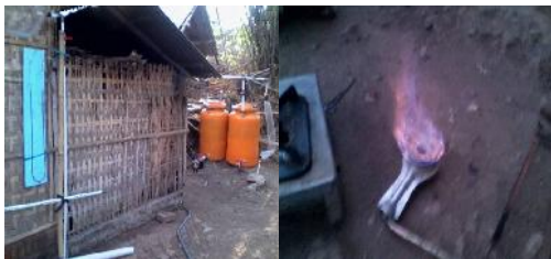
Gambar 2. Instalasi alat yang dibuat

Setelah dilakukan pengujian alat biogas untuk keperluan memasak (kompur biogas) terlihat masyarakat begitu tertarik untuk dapat membuat alat. Adapun unit alat yang dibuat seperti terlihat dalam gambar 2. Dari hasil kegiatan ini, selanjutnya akan dilakukan monitoring secara berkala untuk mengetahui permasalahan dan kendala-kendala yang dialami masyarakat pasca kegiatan.