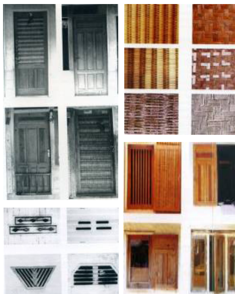
Gambar 5. Hasil alam yang dimanfaatkan untuk elemen rumah penduduk kampung Naga, dan menjadi pola ragam hias yang khas (Sumber: Padma, 2001: 28-29).

Arsitektur merupakan bagian budaya yang ada di masyarakat yang dapat dibentuk dari tiap-tiap unsur dan selalu terdiri dari sistem kebudayaan itu sendiri yaitu konsep, pemikiran dan aturan, adanya sikap perilaku dan tindakan yang mendukung sebagai suatu sistem sosial, serta dari kedua sistem tadi munculah arsitektur sebagai wujud fisik yang bersifat artefaktual. Hal ini dapat kita lihat dari kesahajaan permukiman Kampung Naga yang