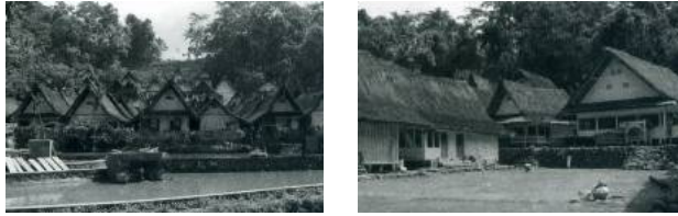
Gambar 3. Rumah-rumah di Kampung Naga yang teratur, bersih, dan rapi, sangat peduli lingkungan, sehingga keseimbangan lingkungan tetap terjaga (Sumber: Padma, 2001: 11).

Di sini juga terdapat pemisahan zona wanita dan pria yang diterapkan pada tata ruang di rumah tinggal mereka. Zona wanita terletak di sebelah kanan rumah yang terdiri dari pawon (dapur) dan goah . Sedangkan rumah sebelah kiri yaitu tepas dan golodog adalah daerah yang banyak digunakan oleh laki-laki. Selain itu terdapat pangkeng (ruang tidur) serta tengah imah (rumah) yang merupakan daerah netral (daerah pria dan wanita) (Padma, 2001: 21). Hal ini sangat sesuai dengan aturan dalam agama Islam yang mereka anut yang memisahkan area wanita dan pria. Kondisi fisik rumah mereka tersebut juga tidak lepas dari aturan-aturan sosial dan religi yang kuat yang mempengaruhi perilaku dan sikap hidup mereka yang berpengaruh pada karya arsitektur mereka yang khas, lihat gambar 4.