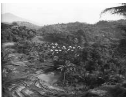
Gambar 1. Letak Kampung Naga yang berada di kaki perbukitan, sehingga menyatu dengan alam.

yang diterapkan secara turun-temurun. Aturan-aturan inilah yang merupakan suatu sistem kebudayaan yang berlaku dan diterapkan pada masyarakatnya dalam kehidupan sehari-hari. Hal ini yang kemudian berpengaruh dan mempengaruhi sikap, perilaku dan tindakan sehari-hari masyarakatnya dalam suatu sistem sosial masyarakat. Dan dari sistem kebudayaan dan sosial inilah muncul lingkungan fisik yang bersifat artefaktual sebagai aplikasi dari kedua sistem tersebut. Sehingga lingkungan fisik Kampung Naga inilah yang menjadi ciri khasnya dalam ranah arsitektur.