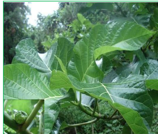
Gambar 1. Daun Ficus septica Burm.F