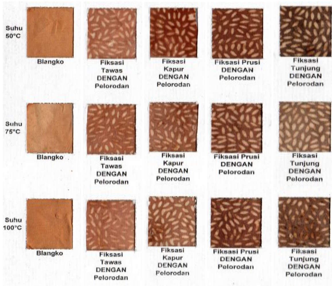
Gambar 3. Pewarnaan gambar pada kain katun

Pewarnaan batik pada media kain sutera setelah pelorodan memberikan arah warna coklat keunguan dan warna lebih tipis dibanding pada media katun. Proses pelorodan pada kain sutera mempunyai kelemahan karena sifat kain sutera yang kurang tahan terhadap sifat alkali, disisi lain soda abu/alkali dapat membantu mempercepat pelepasan lilin sebagai bahan perintang batik.