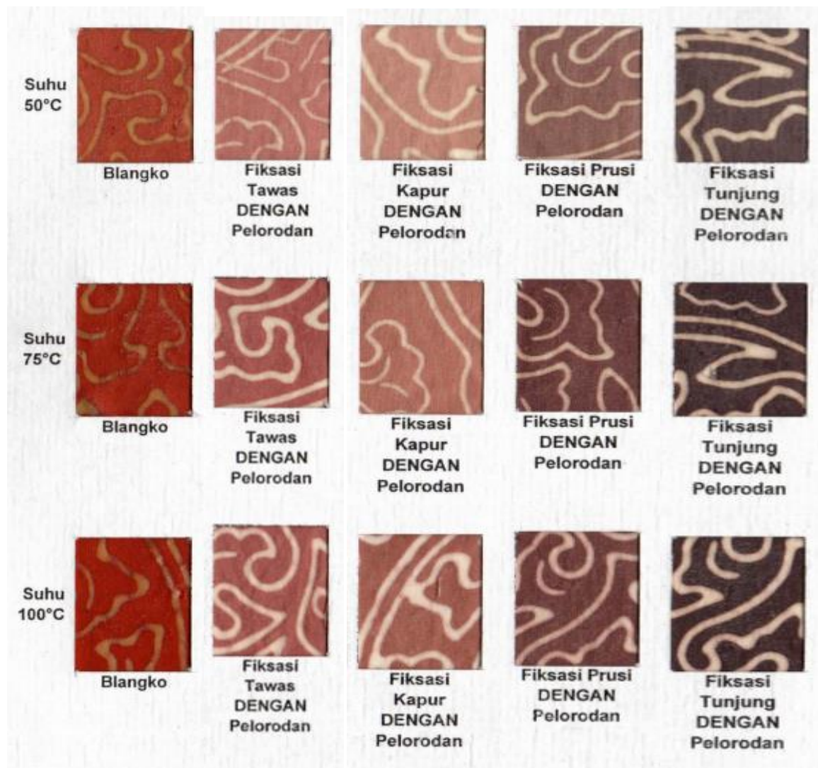
Gambar 1. Pewarnaan kayu secang pada kain katun

Nilai uji ketahanan luntur warna sinar matahari dan pencucian dari zat warna gambir pada berbagai suhu ekstraksi dan jenis fiksasi rata-rata memberikan nilai baik (4-5). Penggunaan suhu dalam ekstraksi gambir tidak memberikan perbedaan terhadap kualitas ketahanan luntur warna sinar matahari dan pencucian. Hal ini berarti pigmen warna gambir yang sudah masuk dalam serat dengan perlakuan fiksasi dapat terikat kuat dan terjadi reaksi sehingga tidak mudah luntur akibat pencucian maupun sinar terang hari.