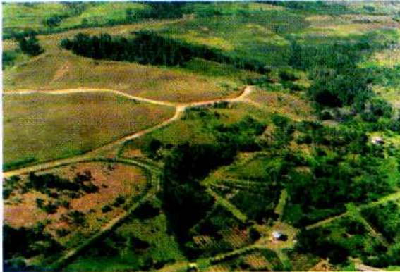
Foto 1. Gambaran seluruh KBW dilihat dari udara