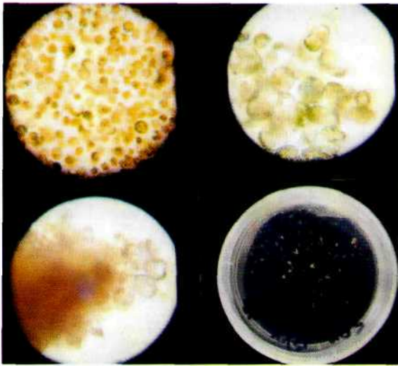
Foto 1: Tahapan pertumbuhan dan perkembangan protoplas mulai dari kiri atas searah jarum jam adalah protoplas hasil isolasi, pembelahan sel, koloni sel dan mikro kalus.