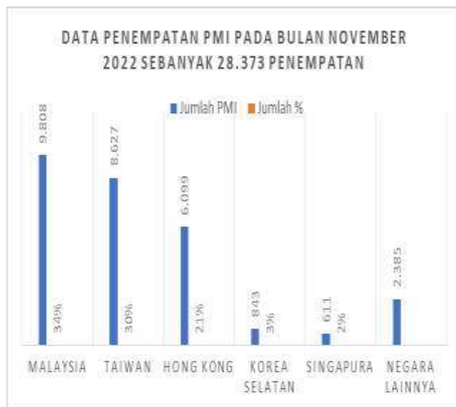
Gambar 1. Data Penempatan PMI Pada Bulan November 2022

penanganan konflik antar budaya. Negara-negara Asia menjadi penyumbang terbesar pekerja migran global, dengan Indonesia, Filipina, Thailand, Myanmar, dan Vietnam mengirim sekitar 18,8 juta pekerja migran (Mauro dkk, 2017). Indonesia sendiri menempati posisi kedua sebagai pengirim pekerja migran, dengan 1,2 juta PMI dari total 6,2 juta imigran yang bekerja di kawasan Asia, termasuk negara tujuan seperti Malaysia, Taiwan, Hong Kong, Korea Selatan, dan Singapura, dengan jumlah 28.373 PMI tercatat pada November 2022 ( BP2MI, 2022) sebagai berikut: