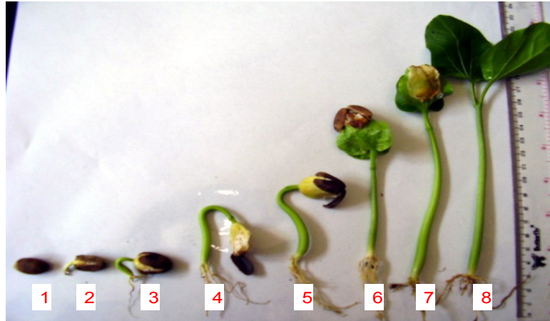
Gambar 2. Pertumbuhan kecambah normal biji jarak ( Jatropha curcas L.)

Perlakuan media semai yang berupa tanah, campuran media tanah dan pupuk kandang (1:1) ataupun campuran Media tanah dan pasir (1:1) tidak berpengaruh terhadap persentase perkecambahan biji jarak. Pada dasarnya perkecambahan biji hanya memerlukan air. Namun demikian penggunaan media tanah dan pupuk kandang (1:1) pada perkecambahan memudahkan dalam pemindahan semai ke