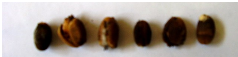
Gambar 1. Biji jarak pagar yang tidak berkecambah ( mati) yang dicirikan dengan kondisi benih yang busuk, tidak berkecambah namun bukan benih yang keras.

Hasil pengamatan terhadap benih-benih yang tidak berkecambah kebanyakan disebabkan adanya jamur (Gambar 1). Faktor jamur secara pasti dapat mengurangi viabilitas. Kondisi-kondisi penyimpanan yang tidak sesuai di daerah tropik mendorong kehilangan viabilitas dengan cepat. Adapun biji jarak pagar yang berkecambah baik dan dapat tumbuh normal disajikan pada Gambar 2.