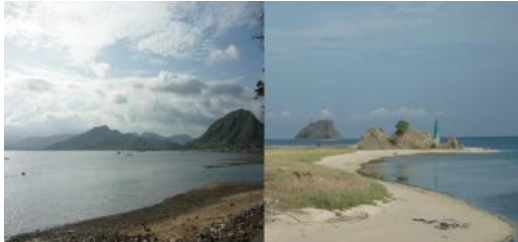
Gambar 2.1 Potensi dan View Kepulauan Lombok

khususnya nelayan tradisional memang memprihatinkan. Padahal potensi pesisir dan laut begitu besar dimana laut Indonesia termasuk yang paling luas di dunia (Rokhmin, 2004).