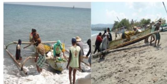
Gambar 2.2 Topografi Pantai Yang Curam

Kendala yang dialami oleh para nelayan selain minimnya peralatan biasanya kondisi geografis dari pantai tempat mereka menambatkan perahunya ada bentuk pantai yang curam dan pantai yang tidak curam. Dalam kondisi pantai yang curam, biasanya nelayan mengalami kesulitan menambatkan perahu karena bentuk pantainya yang curam. Seperti tampak dalam gambar 2.2, untuk menambatkan perahu nelayan membutuhkan tenaga yang banyak dan biaya yang banyak pula.