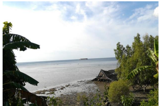
Gambar 1 Abrasi dan kenaikan permukaan air laut di sisi utara Bawean

Kondisi tersebut juga didukung oleh keadaan pulau Bawean yang mengalami perubahan dari waktu ke waktu. Berdasarkan dari hasil observasi dan wawancara dengan warga ditemukan bahwa abrasi di Bawean dimulai sejak tahun 2000. Sepanjang pesisir Bawean baik utara maupun selatan memiliki kerentanan cukup tinggi, terlihat di sepanjang pantai Tanjungori hingga Ponggoh, Kecamatan Tambak, air laut mulai melahap pasir-pasir dan mengancam daratan di wilayah tersebut. Hal tersebut juga dapat dilihat dari adanya pembeconan di sepanjang wilayah tersebut. Sementara di wilayah Daun, Kecamatan Sangkapura, ditemukan tingkat abrasi yang tinggi mengakibatkan air laut semakin mendekati daratan bahkan menenggelamkan beberapa rumah nelayan. Berdasarkan informasi dari warga tingkat kenaikan permukaan air laut diperkirakan mencapai 0,4 sampai 0,5 meter. Selain itu keberadaan banjir rob juga menjadi ancaman, karena daya rusaknya yang semakin besar.