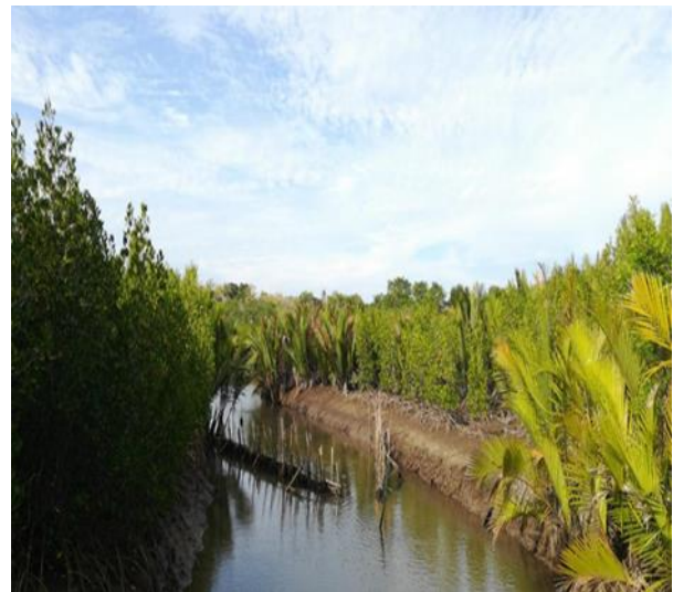
Gambar 2 Kawasan konservasi mangrove di Desa Daun

Langkah yang diambil sebagai usaha menjaga ekosistem di Bawean yakni kelompok nelayan se Pulau Bawean melakukan koordinasi dengan