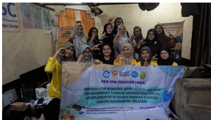
Gambar 3. Dokumentasi Kegiatan Penyuluhan Di Rumah Singgah Kanker