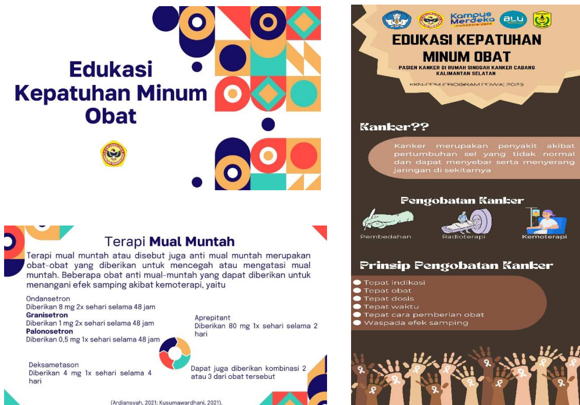
Gambar 1. Tampilan Media Bantu Penyuluhan Power Point dan X-Banner

Sebanyak 10 peserta ikut serta dalam kegiatan pengabdian. Acara dibuka dengan perkenalan diri dan penyampaian tujuan kegiatan. Kemudian dilakukan penyuluhan secara tatap muka langsung dengan menjelaskan materi dengan media bantu power point dan x-banner. Pengabdian dilanjutkan dengan sesi diskusi dimana terdapat beberapa orang peserta yang mengajukan pertanyaan seputar materi dan pemateri menyampaikan jawaban atas pernyataan yang diajukan. Tahapan akhir dari kegiatan adalah pengisian kuesioner dengan tujuan untuk mengukur pemahaman peserta terkait materi yang telah disampaikan.