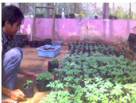
Gambar 1. Bibit tomat transgenik hasil pemindahan dari bak persemaian ( Transgenic tomato seedling resulted from seeds germination )

persemaian. Demikian pula kecambah yang dipindahkan ke media polibag kecil rata-rata dapat tumbuh dengan baik (Gambar 1), sehingga dapat dengan mudah dipindahkan ke dalam media tanam pada ember plastik besar dan dapat tumbuh normal hingga dewasa di rumah kaca FUT.