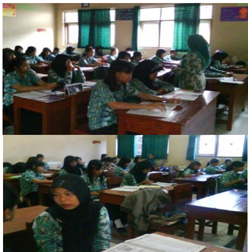
Gambar 3. Situasi pembelajaran konvensional

berbicara juga hanya siswa-siswa tertentu sehingga belum semua siswa aktif dalam proses pembelajaran tersebut.