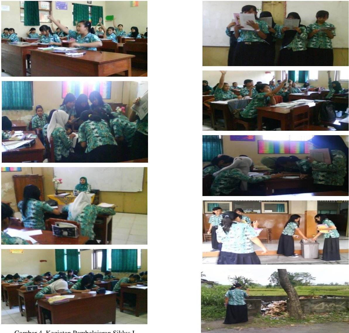
Gambar 4. Kegiatan Pembelajaran Siklus I

Pada pelaksanaan Evaluasi Standar kompetensi memahami polusi dan dampaknya pada manusia dan lingkungannya materi Dampak Polusi Terhadap Kesehatan Manusia dan Lingkungan, untuk mengukur hasil belajar siswa kelas XI AK 1.