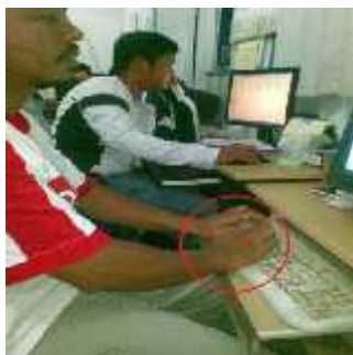
Gambar 1. Postur Janggal