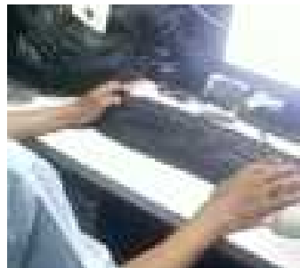
Gambar 10. Postur Alami

Gambar 1, gambar 2, gambar 3, gambar 4 dan gambar 5 menjelaskan tentang postur