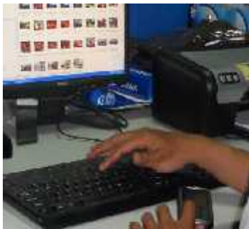
Gambar 7. Postur Alami