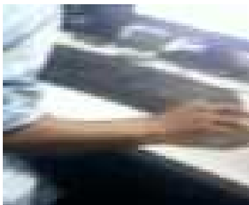
Gambar 9. Postur Alami