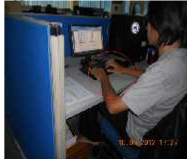
Gambar 6. Postur Alami