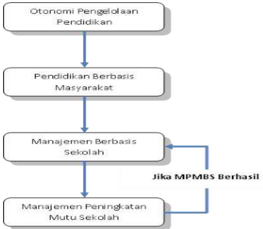
Gambar Skema Berpikir Kebijakan MBS di Indonesia