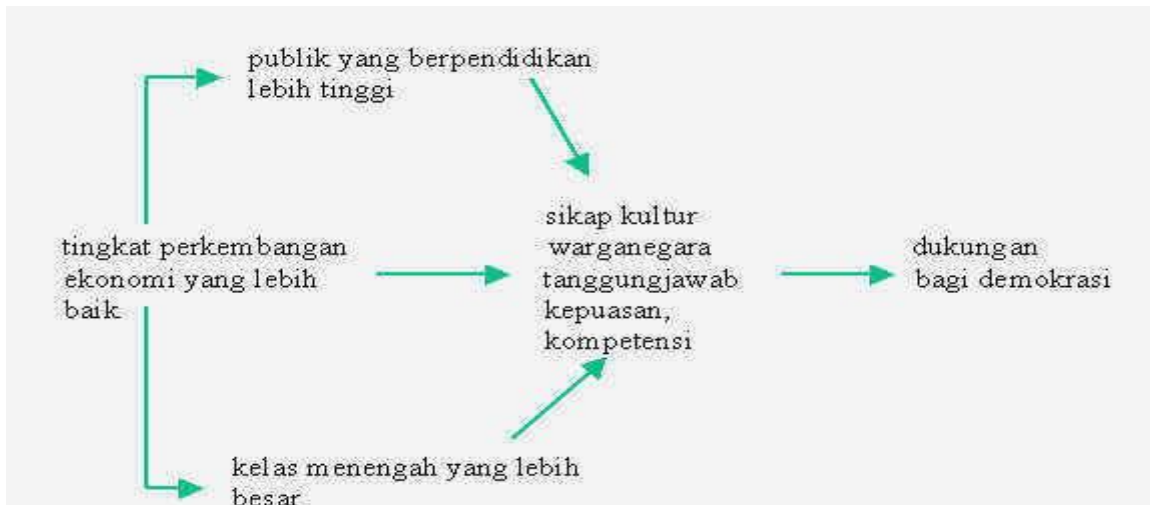
Gambar 1. Perkembangan Ekonomi Sebagai Sebuah Faktor Dalam Demokratisasi

Berkaitan dengan hubungan pendidikan dan perkembangan ekonomi ini, Edgar Faure pada makalahnya tentang "Pendidikan dan Hari Depan Umat Manusia" 7 menegaskan bahwa kecepatan perkembangan pendidikan dan pengajaran selalu selaras dengan kecepatan langkah perkembangan ekonomi. Jika ekonomi berkembang cepat, maka pendidikan pun cenderung cepat mengembangkan pengetahuan guna menyiapkan tenaga-tenaga yang dibutuhkan pada bidang pembangunan ekonomi.