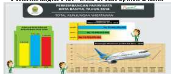
Gambar Perkembangan Pariwisata di Kabupaten Bantul

Adanya sektor pariwisata sangatlah mendukung adanya pembukaan lapangan usaha, yang juga menjadi penggerak pemasukan Pendapatan Asli