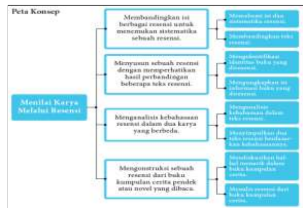
Gambar 3. Konsep Materi Meresensi Novel

Konsep materi meresensi novel terdiri atas memahami isi dan sistematika resensi, membandingkan teks resensi, mengidentifikasi identitas buku yang dirensi, mengungkapkan isi informasi buku yang dirensi, menganalisis kebahasaan dalam teks resensi, menyimpulkan dua teks resensi berdasarkan kebahasaannya, mendiskusikan hal-hal menarik dalam buku kumpulan cerita, dan menulis resensi. Untuk lebih jelas dapat dilihat pada gambar berikut ini.